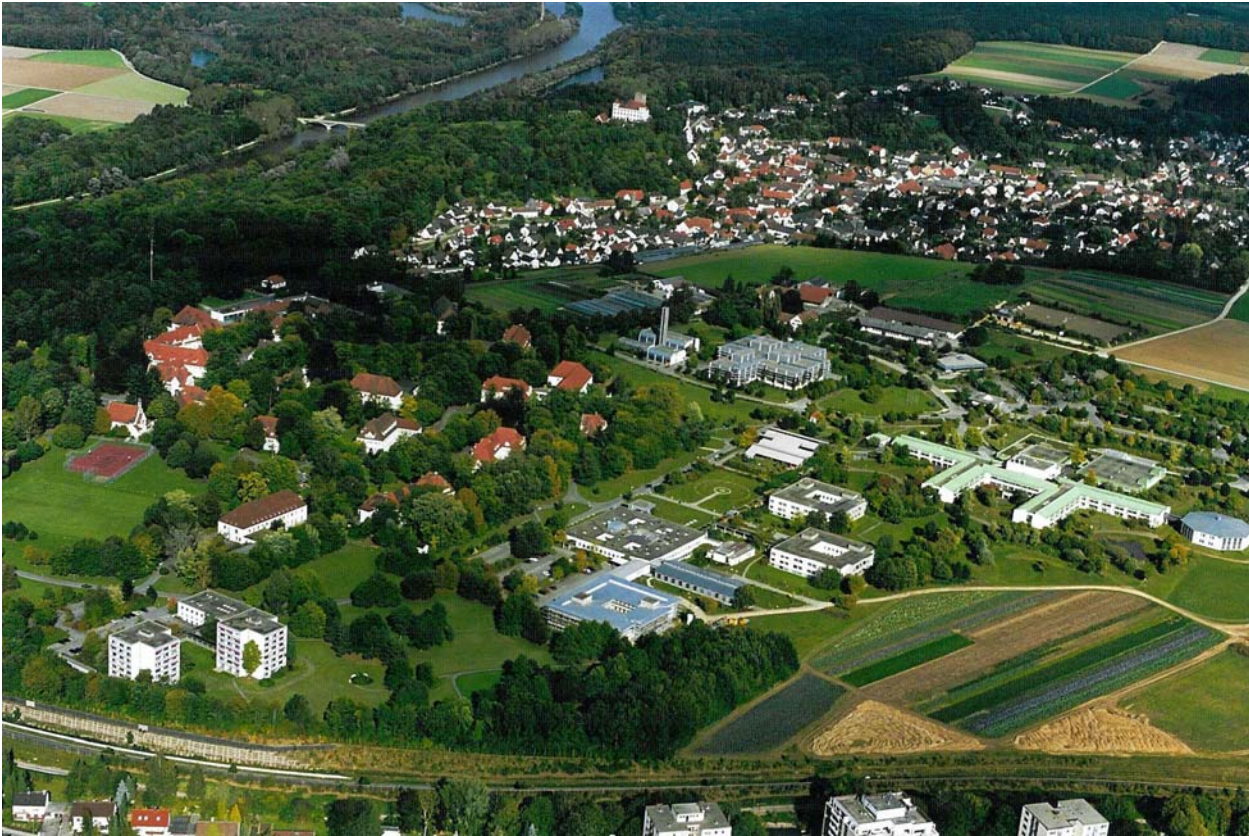
Abbildung: Luftbild des Bezirkskrankenhauses Günzburg